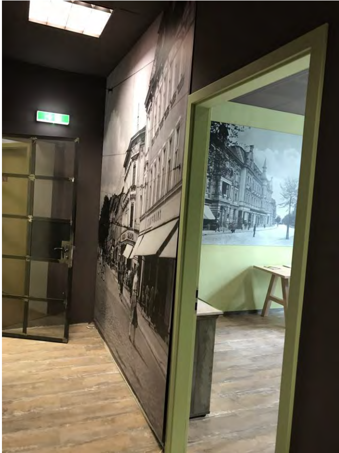
Inspiration im WHG Coworking Place

Das Raumdesign im Coworking und im Nachbarschaftstreff greift von der Idee, über das Konzept und Umsetzung die Historie des Hauses und der Stadtentwicklung entlang der Eisenbahnstraße hervorragend auf. Das Design ist von der WHG. In den Räumen gelingt es mühelos in die Geschichten einzutauchen, die die Bilder erzählen.