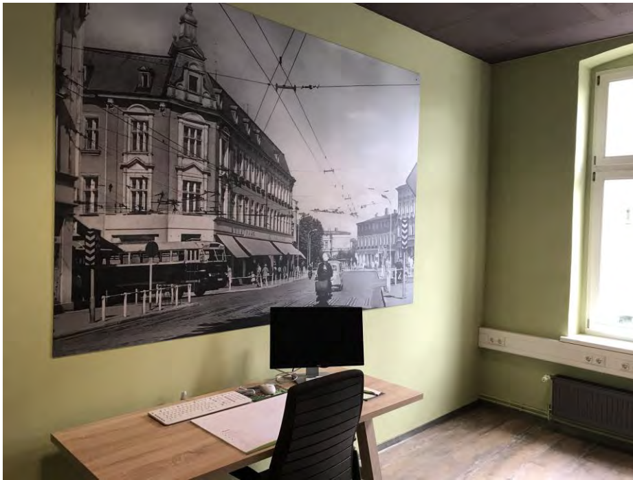
Arbeitsplatz im WHG Coworking Place

Die WHG bietet ab Juni 2021 in den Räumen über dem Nachbarschaftstreff mobiles und ortsunabhängiges Arbeiten in einem eigenen Coworking Space .