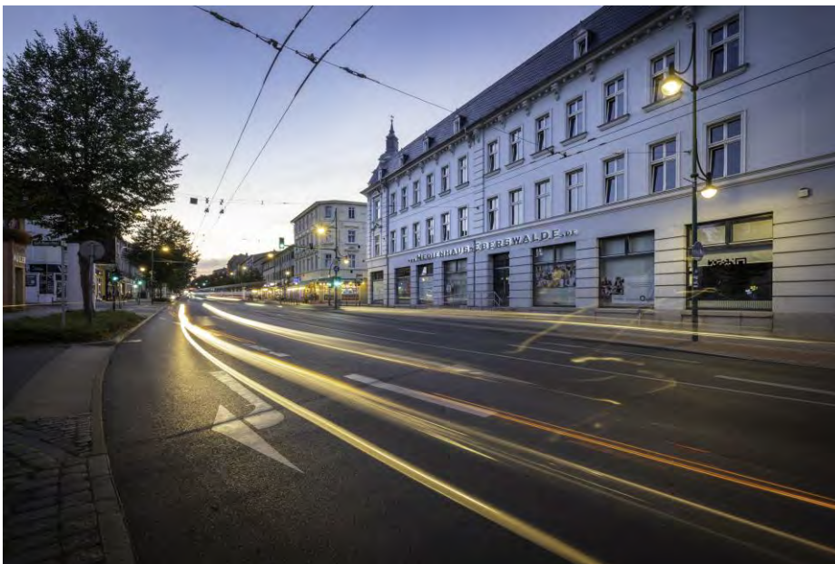
Coworking in Eberswalde

Die WHG unterstützt dieses zukunftsorientierte Projekt der Innovation zur regionalen und überregionalen Stadtentwicklung Eberswalde , um die gemeinschaftlichen Interessen „Wohnen, Leben, Arbeiten & Gestalten, Mitwirken & Mitmachen“ an diesem Standort für Menschen aller Generationen und Herkunft einen Wirkungskreis für nachbarschaftliche, ökologische, regionale und wirtschaftliche Synergien des Zusammenkommens und Zusammenarbeitens im aktiven kommunikativen Austausch interessenübergreifend zu fördern.