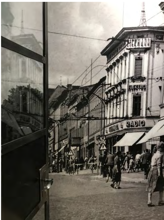
Hereinspaziert in den WHG Coworking Place