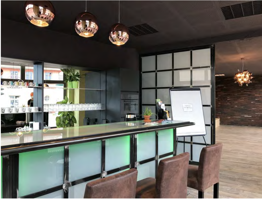
Blick in den Coworking-Treffpunkt

fen in Gruppen zu Workshops und Veranstaltungen. Thematischer Anker für den Magnet ist wie für die Thinkfarm gemeinschaftliches und kreatives Handeln hin zu einer sozial gerechten und ökologisch nachhaltigen Gesellschaft.