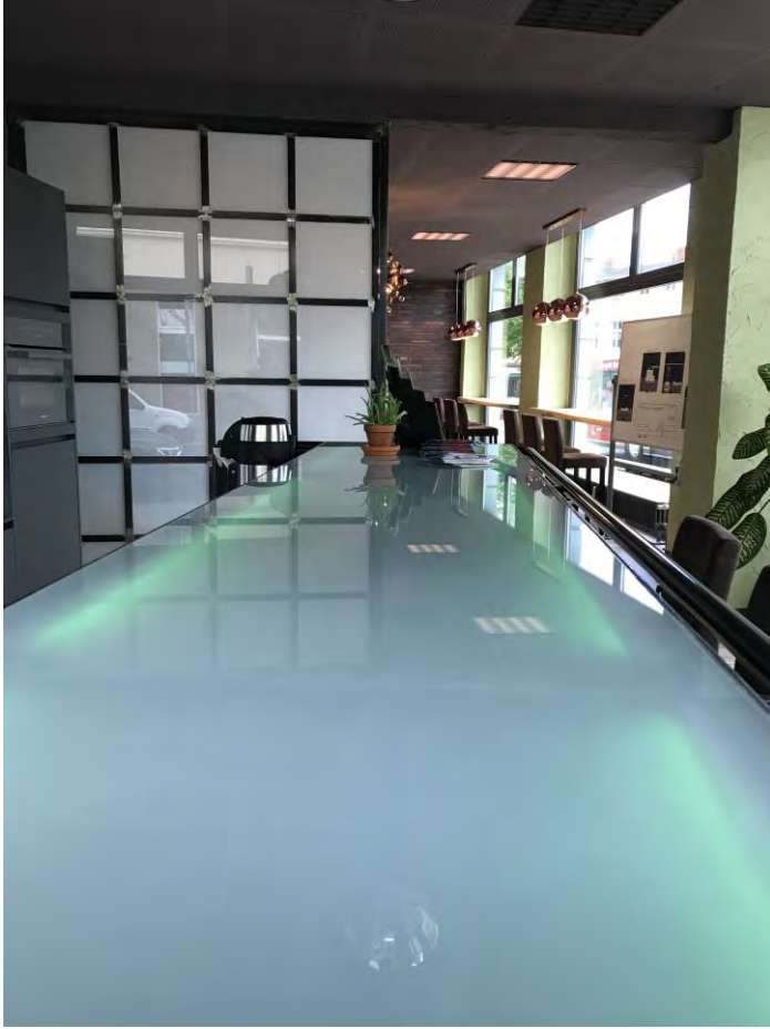
Blick in den Coworking-Treffpunkt

Das Konzept des mobilen Arbeitens im COWORKING SPACE in Eberswalde mit dem Schwerpunkt ortsunabhängiges Arbeiten ist längst erprobt und steigend nachgefragt. Im Fokus stehen dabei regionale Unternehmen, Selbstständige, Schüler, Studenten und Freiberufler sowie die Förderung eines fachbereichs- und branchenübergreifenden Austausches , um wirtschaftliche und nachhaltige Synergien der Stadtentwicklung zu ermöglichen. So könnte auch der Austausch im Coworking umgesetzt werden, wenn sich das Modell des mobilen flexiblen Arbeitens auch bei Ämtern und Behörden stärker durchsetzt und deren Mitarbeitende das Angebot im Coworking nutzen.