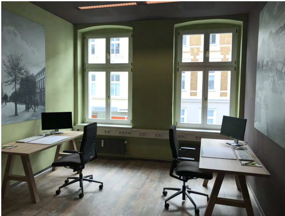
Blick in die Räume des WHG Coworking Place

temporäre Büronutzung u.a. für Projektpartner der WHG variabel angeboten und genutzt werden.